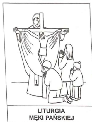
LITURGIA MĘKI PAŃSKIEJ

W wieczniku Chrystus uobecnił swoją ofiarę. Ustanowienie Eucha- rystii wspominamy w _____